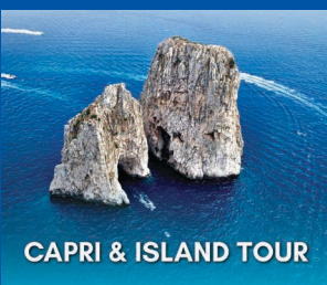
CAPRI & ISLAND TOUR