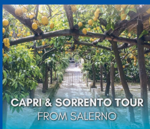
CAPRI & SORRENTO TOUR FROM SALERNO