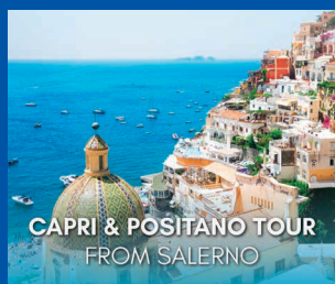
CAPRI & POSITANO TOUR FROM SALERNO