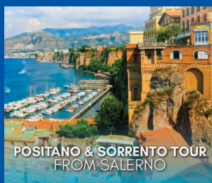
POSITANO & SORRENTO TOUR FROM SALERNO