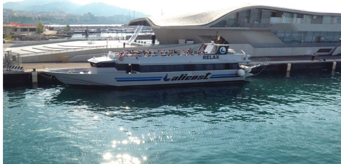
Un aliscafo Alicost

Dal primo aprile tornano operativi i collegamenti gestiti da Alicost Spa, la società che grazie ai suoi servizi marittimi veloci mette in comunicazione i più importanti scali del Golfo di Salerno con i principali approdi della Costa del Cilento, fino ad arrivare al porto di Napoli e alle isole di Capri ed Ischia. E tornerà operativa a giugno anche la tratta che collega Salerno alle isole Eolie (Stromboli, Panarea, Lipari e le altre straordinarie perle dell'arcipelago siciliano).