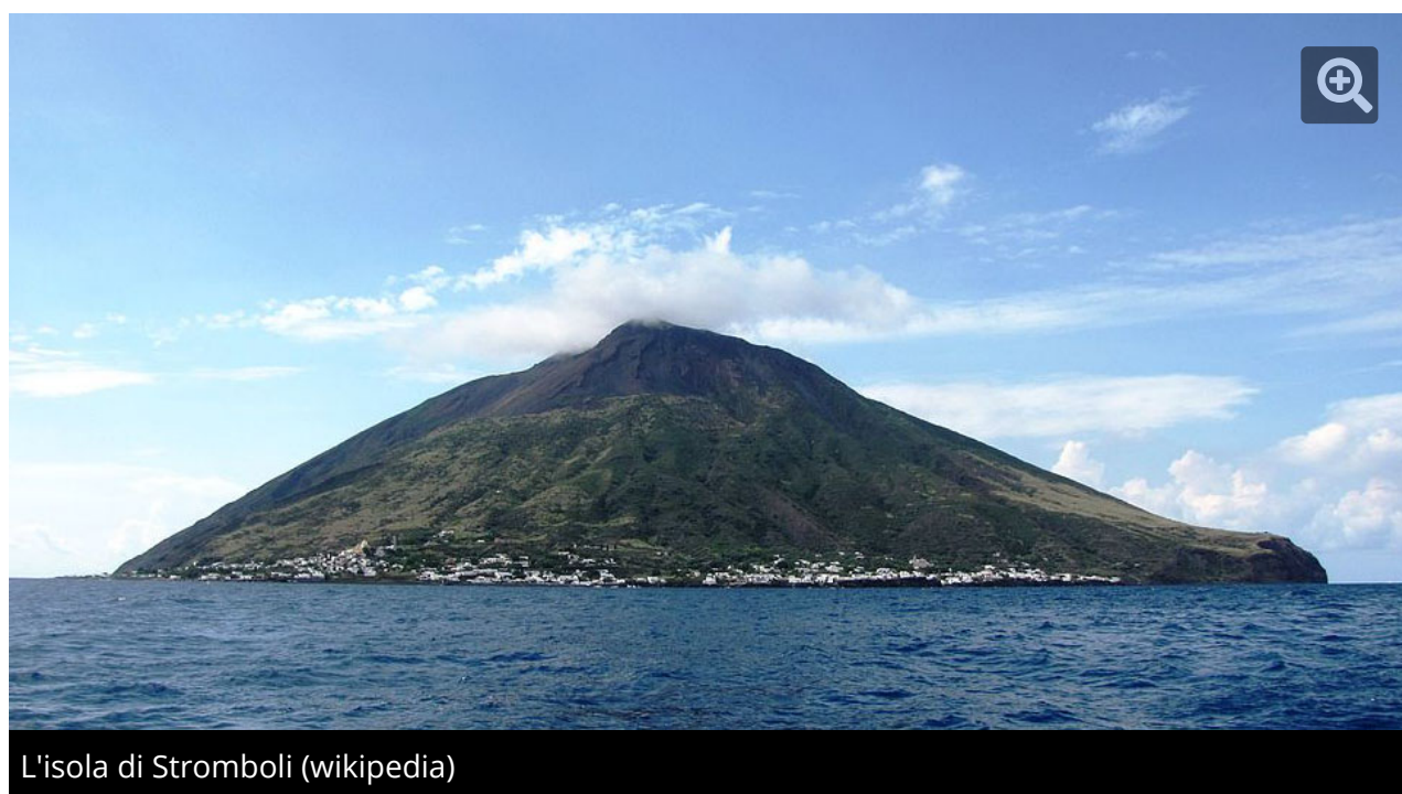
L'isola di Stromboli

Dal 21 giugno collegamenti settimanali veloci con Stromboli, Panarea, Salina, Vulcano e Lipari