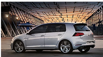
Golf 7. Scoprila anche nella versione a metano. Richiedi un preventivo ( Volkswagen )