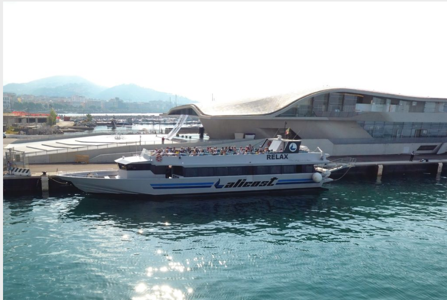
Le destinazioni: Capri, Ischia, Eolie, Cilento, Amalfi Coast e Napoli

(Comunicato) Dal primo aprile tornano operativi i collegamenti gestiti da Alicost Spa, la società che grazie ai suoi servizi marittimi veloci mette in comunicazione i più importanti scali del Golfo di Salerno con i principali approdi della Costa del Cilento, fino ad arrivare al porto di Napoli e alle isole di Capri ed Ischia. E tornerà operativa a giugno anche la tratta che collega Salerno alle isole Eolie (Stromboli, Panarea, Lipari e le altre straordinarie perle dell'arcipelago siciliano).