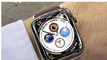
Questo orologio è davvero straordinario, costa solo 59€ ( teultimenotizieblog.com )